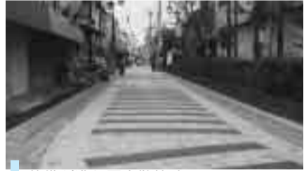
整備が進む歴史散策路