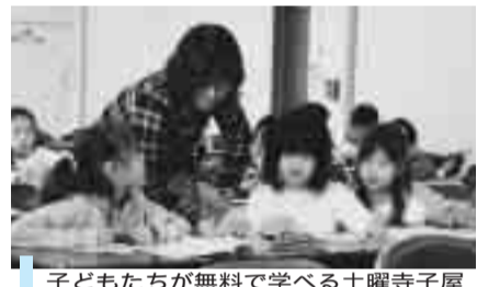
子どもたちが無料で学べる土曜寺子屋

建設後のあずま保育園においては、待機児童対策として定員を30人増の110人にするるとともに、一時保育及び地域子育て支援センター事業を実施し、保育サービスの実現を図ってまいります。