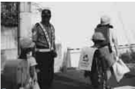
児童の安全を見守る市民ボランティア