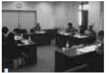
市民参画のもと行われている審議会

また、平成20年度に設置した改革検討委員会での議論や、職員に対する意識調査の結果を踏まえ、「コンプライアンス・説明責任が果たせる職員づくり」という目標に向け、全庁的な職員対応マニュアルの充実などに努め、更なる市民サービスの向上をめざします。