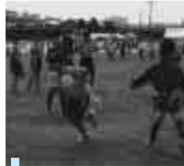
スポーツフェスティバル

また、スポーツ振興事業につきましても、各種スポーツ大会・教室を開催し日常生活に密着したスポーツ活動を推進いたします。さらに、高齢者を対象としたスポーツ教室を開催し、健康づくりや仲間づくりを通じて、高齢者がいきいきと生活できる事業の推進を図ります。