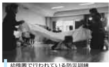
幼稚園で行われている防災訓練

してくれた職員を誇りに思っており、素晴らしい市民、そしてその思いに添えていこうとする職員、さらに草加市の様々な都市特性を考えたとき、このように大変厳しい社会状況ではありますが、私は、草加市がこれらの荒波に耐え、それを乗り越えていくことができるだけのポテンシャルを持っている