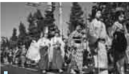
盛大に行われた草加ふささら祭り