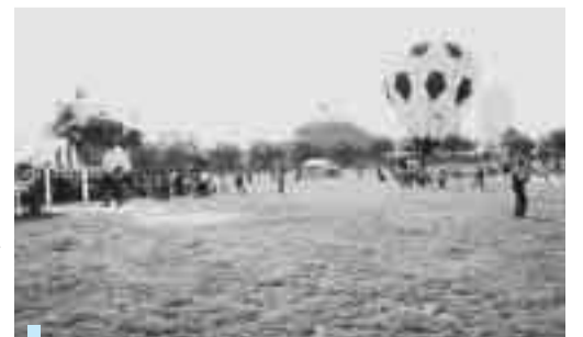
市民の憩いの場として親しまれている綾瀬川左岸広場

また、旧道モデル地区道路整備につきましては、歩行者、自転車そして障がいのある人が安心して通行できる道路整備を推進するため、用地取得等を実施してまいります。