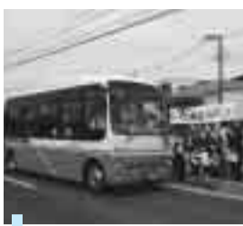
遊馬町に開通したバス路線

物理的なセキュリティ対策につきましては、外部接続機器管理システムの構築により、庁内端末の情報セキュリティ強化を図り、人的なセキュリティ対策につきましても、ISO27001の認証を更新するとともに、そのノウハウを活かした全庁的な情報セキュリティ対策の強化を図ります。