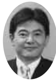
草加市長 木下博信