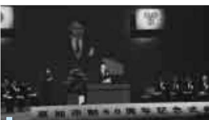
草加市制50周年記念式典

たとえば産業振興課で行っている中小企業者への緊急保証制度の認定は、一昨年同期と比べて昨年11月には数十倍の件数となりました。この11月の件数というのは、昨年4月から10月までの7か月分の申請件数とほぼ同じ件数です。緊急経済対策のため対象となる業種が拡大したことも件数増加の大きな要因ではありますが、それ以上に経営の逼