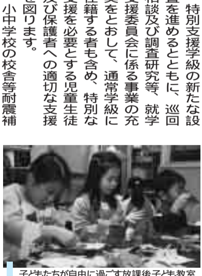
子どもたちが自由に過ごす放課後子ども教室

3点目は、「子どもたちの健やかな成長」です。草加の持続的な発展のためには、未来を担う子どもたちが健やかに育つていく必要があります。そのためには、子どものうちから基礎・基本をしっかりと身につけ、応用する力を加えていく必要があります。また、子どもが小さい時から子どもとして尊重され、より良い環境で育まれる必要があります。そのためには、信頼される学校教育を推進し、いつまでもこのまちで子どもを