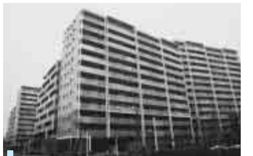
建て替えが進む草加松原団地