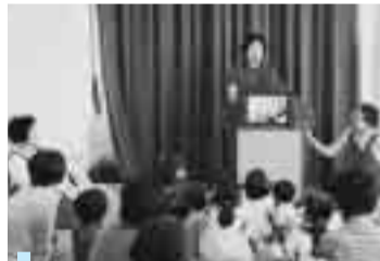
中央図書館での絵本の読み聞かせ

また、スポーツ振興事業につきましても、各種スポーツ大会・教室を開催し日常生活に密着したスポーツ活動を推進いたします。さらに、高齢者を対象としたスポーツ教室を開催し、健康づくりや仲間づくりを通じて、高齢者がいきいきと生活できる事業の推進を図ります。