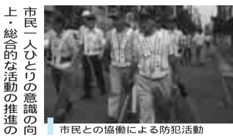
市民との協働による防犯活動

また、安全安心の充実には、犯罪抑止効果があると言われている青色照明を設置し、その効果の検証を行うてまいります。また、安全安心の充実については、市民が暮らすに守るといふ視点では、支え合いによる公的扶助制度の維持や、健やかな生活が送れるような体制をつくっていくことが必要だと考えます。