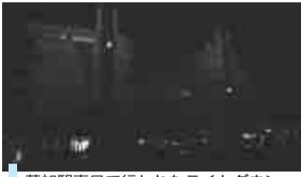
草加駅東口で行われたライトダウン