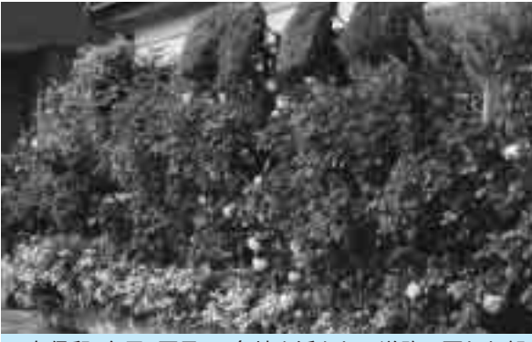
久保邸(弁天2丁目):角地を活かし、道路に面した部分に花木をバランスよく連続させ、通り行く人の目を楽させています。