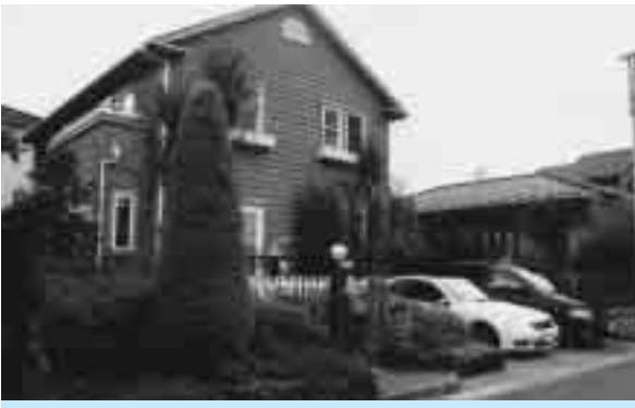
清水邸(谷塚町):外壁には使用が難しいとされる緑色を上手に使ってまちなみと調和させ、色の選定に優れています。