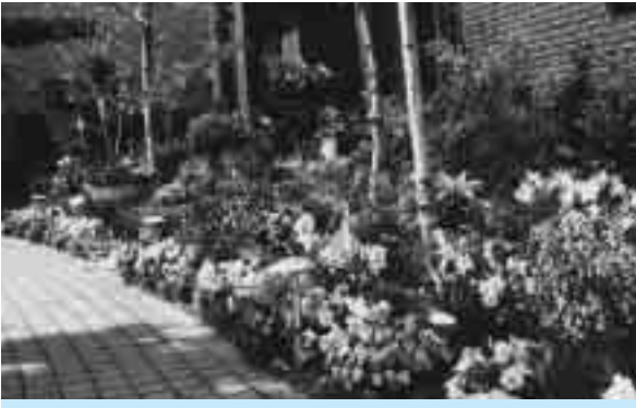
藤波邸(青柳5丁目):奥を日本庭園風、手前を洋風とし、植える花や樹木の高さに変化を持たせるなどパリエーションに富み、センスと完成度の高い作品です。