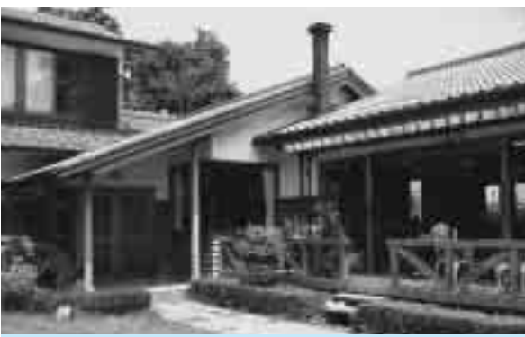
若林邸(青柳4丁目):自然を大切に考え、敷地内にある古木を残し、古いものと新しいものをうまく調和させて草加らしさを出しています。

昨年10月に市の景観計画・景観条例が実施に移され、制度として景観づくりが始まりました。今後は、制度を運用していく過程で、計画や基準に合わせるだけでなく、個々の価値観の違いを理解し、誰もが納得し、共有するものを目指し、景観をとおして快適に住みよいまちづくりが進んでいくことを期待しています。