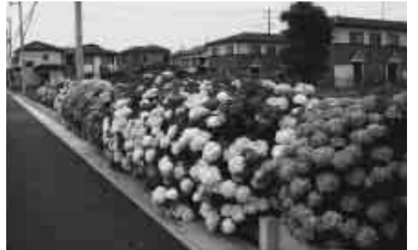
小櫃邸(新栄町):畑の道路沿いにボリューム感のある花を植え、農地を生かして地域の景観向上に貢献しています。

「建物景観」、「保存景観」、「緑化」、「活動」の4部門からなり、受賞作品は次のとおりです。 なお、今回は保存景観部門に該当する作品の応募・推薦はありませんでした。