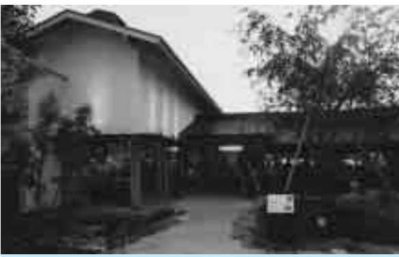
草加せんべいの庭(金明町):草加ならではの景観と言えるせんべい店に、新しいデザインを取り入れ、店舗の景観づくりに先導的な役割を果たしています。