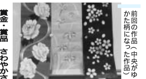
前回の作品(中央がゆかた柄になった作品)

賞金・賞品 さわやかさん賞(1点) 5万円、入賞デザインゆかた、市特産品 観光協会賞(1点) 1万円、市特産品 地域産業振興協議会賞(1点) 1万円、市特産品 佳作(数点) 市特産品 4月13日(月)までにデザイン画の裏に住所・氏名(ふりがな)・年齢・電話番号・あればEメールアドレスを記入し、〒340-8550産業振興課へ。同課または伝統産業展示室(草加市文化会館内)への持参も可。なお、入賞者には直接連絡します。入賞作品は4月に市ホームページに掲載します。