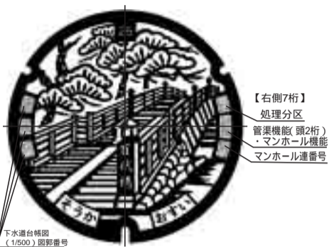
【右側7桁】処理区分 【管渠機能(頭2桁)・マンホール機能(マンホール連番)】

家庭から出る生活排水などを集めて、川や海の水をきれいに保つ下水道。マンホールはこの下水道点検などのために、一定の間隔で道路に設置されています。マンホールを覆う蓋には、何種類かのデザインがあり、松並木と百代橋をモチーフにしたものがありません。これは「デザインマンホール蓋」と呼ばれ、平成10年の市制施行40周年を記念して、市民投票で決定した絵柄があしらわれていました。