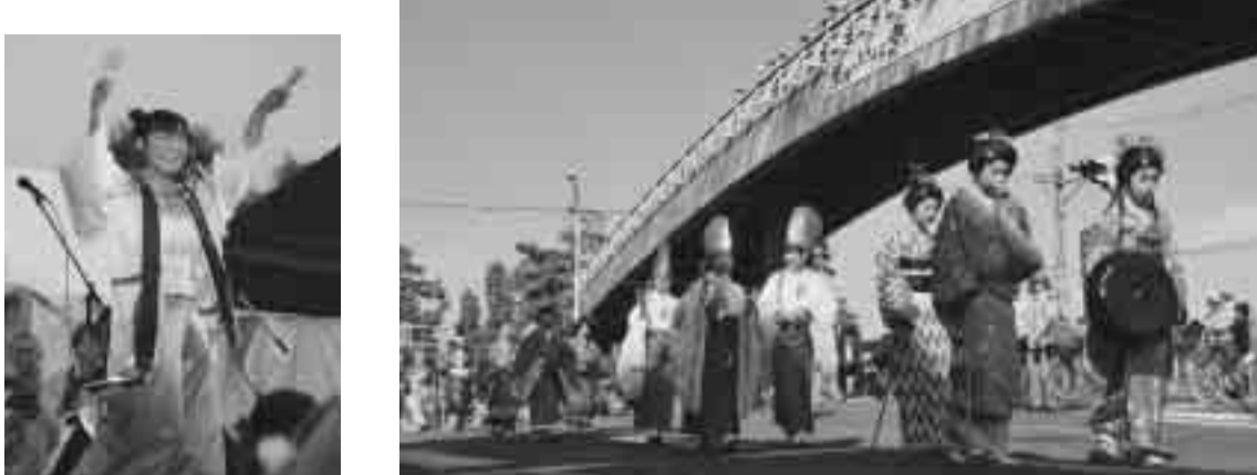
草加ふさとささら祭り

11月1日午後から3日まで、市制施行50周年を記念し草加ふさとささら祭りが開催されました。ふさとささら祭りは文化の広場、さわやかさんコンテスト、商工会議所まつり、宿場まつり、市民まつりの5大イベントが同時開催となったもの。この祭りには、県道足立越谷線から旧道までの道路が通行止めとなり、子ども大行列などが、松原大橋から市役所までをパレードしました。期間中31万人が訪れ、さまざまなイベントを楽しみました。