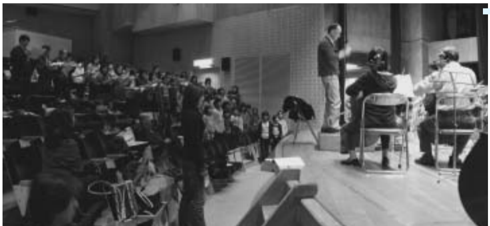
11月23日の青少年コンサートに向けジュニアオーケストラと合唱の練習をする皆さん

のさまざまなジャンルの音楽団体や愛好家が集まって、園児や小・中学生、高校生も交えて、どこでも音楽にふれあえる市民まつりの音楽版をやってみよう」と夢を語ります。