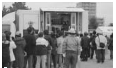
起震車による地震体験