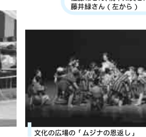
文化の広場の「ムジナの恩返し」

11月1日、草加商工会議所は市制施行50周年を祝い草加松原遊歩道に黒松5本、ハープ橋脇に枝垂れ桜2本を植樹。また、同遊歩道のじゃぶじゃぶ池付近では児童館や児童クラブなどの児童が、50年後に託したタイムカプセルを埋めました。