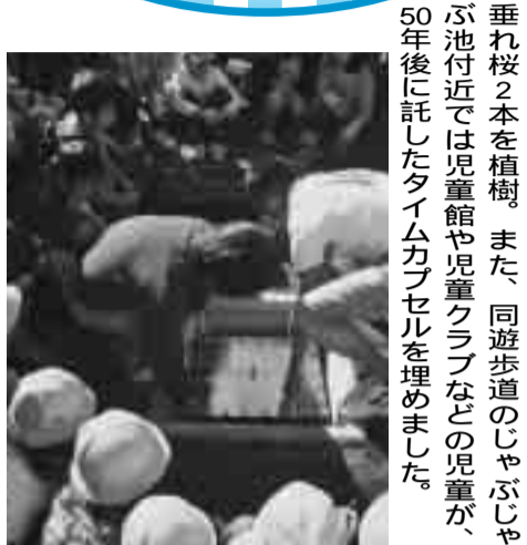
植樹を記念したテープカット

11月1日、草加商工会議所は市制施行50周年を祝い草加松原遊歩道に黒松5本、ハープ橋脇に枝垂れ桜2本を植樹。また、同遊歩道のじゃぶじゃぶ池付近では児童館や児童クラブなどの児童が、50年後に託したタイムカプセルを埋めました。