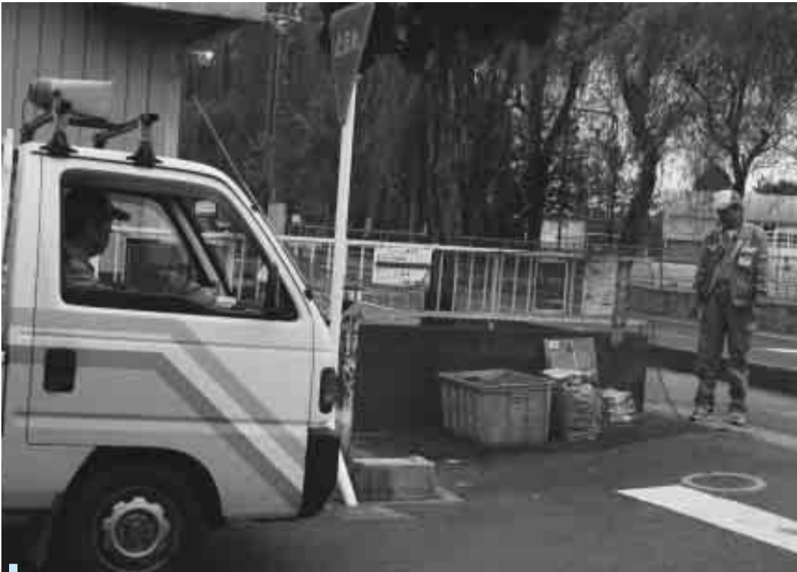
市職員による持ち去り防止パトロール

9月1日、市は違法な資源物持ち去りを繰り返す悪質な持ち去り者を告訴しました。後を絶たない古新聞やアルミ缶などの持ち去りに対して平成17年1月に罰則等を盛り込んだ条例を施行。しかし、集積所が明確ではないという理由から告訴に至りませんでした。そこで、今年3月から町会・自治会の協力を得て「持ち去り禁止看板」等を掲示し、市の集積所であることを明確にしたことにより、告訴が可能となりました。市は今後も持ち去りは違法であるという厳しい態度で持ち去り者に対処していきます。