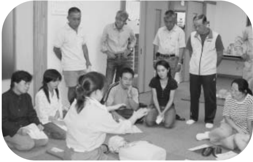
真剣なまなざしで普通救命講習を受ける原町会の皆さん

大規模災害時には、市・消防・警察などの防災関係機関は、組織の機能を挙げて災害活動を行います。しかし、道路や橋などが損壊するなどで活動が阻害され、災害発生直後に期待する援助を受けられない可能性があることは、多くの災害報道を見て明らかです。