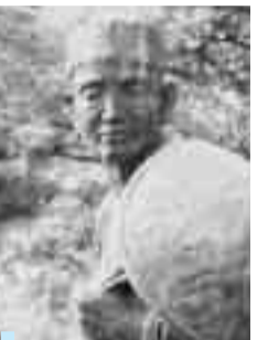
札幌河岸公園に立つ松尾芭蕉像

高齢者のための防犯教室 9月4日(木)午後1時30分～3時 会場はふれあいの里 振り込め詐欺・ひったくり・ドロボウに遭わない防犯のポイント教えます 60歳以上対象