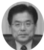
増田寛也 総務大臣