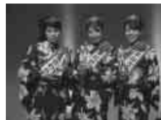
草加市観光協会(糸井守会長)では、草加市を明るくさわやかな笑顔でPRしてくれる女性を募集します。

水道部では、水道事業の現状を評価し、施設の更新や耐震化などの課題を抽出したうえで、今後10年間で取り組むべき施策をまとめた「草加市水道ビジョン」の素案を作成しました。この素案について皆さんの意見を募集します。 素案は、市役所情報コーナー・水道部経営管理課で、概要は上記場所のほか、サービスセンター・公民館・コミュニティセンターなどで配布し、それぞれ閲覧できます。また、市ホームページでも閲覧できます。 意見がある人は、住所・氏名・電話番号を記入し、8月1日(金)～20日(水)に〒340 8555草加市水道部経営管理課へ。ファクス・Eメールでも可。☎925・3132 925・5046 E: keieikanri@soka-waterworks.jp