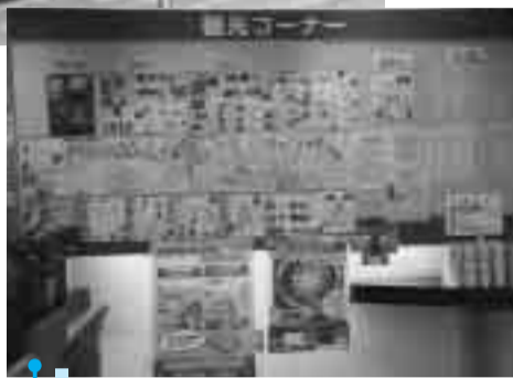
新設された観光コーナー