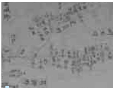
伊能図の草加部分 伊能忠敬記念館所蔵

今から200年以上前に、50歳で隠居後、暦学や測量学、さらに天文学を学び、日本中を歩き(測量で歩いた距離は3万5000キロメートル)に及ぶとい(う)、伊能図といわれる地図を作製した人がいました。皆さんもご存じの伊能忠敬です。今回は、千葉県香取市にある伊能