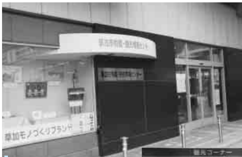
物産・観光情報センター外観

ンとして再生する「今様・草加宿」事業を進めています。その中で、エリア内の見どころや特選店などを紹介するガイドマップを作成。公共施設のほか東武鉄道52駅などにも配布して草加市を広くPRした結果、最近では市内でガイドマッ