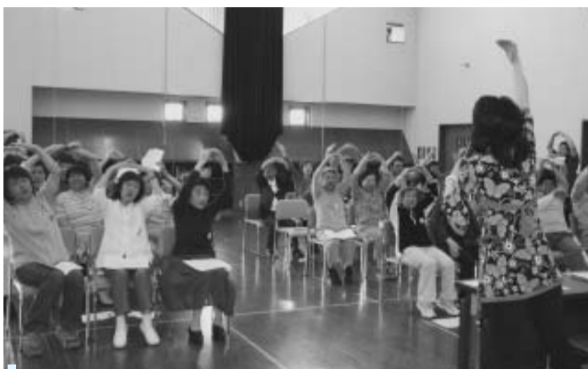
音楽から生まれる一体感が満ちあふれる教室

「音楽をとおして高齢者や障がい者が心を開く助けになりたい」と思っている活動してきました。漢方薬のように効き目はゆっくりですが、地道に続けていくことで、皆さんが持つ無限の可能性をいっしょに見つけられると確信しています。私も逆に皆さんから元気をもらっています」と笑顔で語ります。