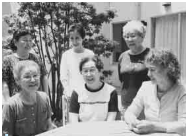
年を重ねても、みんな明るく元気。健康は人生の宝です

「メタボリック症候群」、最近よく耳にしませんか。自覚が無くても、放っておくと心臓病や脳卒中、糖尿病につながる危険な状態のことです。日本では実に、40歳〜74歳の男性の2人に1人、女性の5人に1人がその予備群と言われています。このメタボリック症候群を早めに発見し、病気を予防しようと、7月から健康診査の制度が変わります。これまで市が実施してきた「基本健康診査」を改め、40歳〜74歳の人には「特定健康診査」と「特定保健指導」を、75歳以上の人には「後期高齢者健康診査」を実施します。また、「生活機能評価」はこれまでどおり65歳以上の人を対象に実施し、健診と併せて皆さんの健康づくりを応援します。