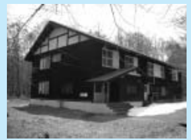
奥日光自然の家宿泊施設(西館)