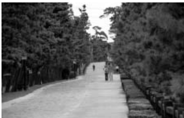
松並木・草加松原