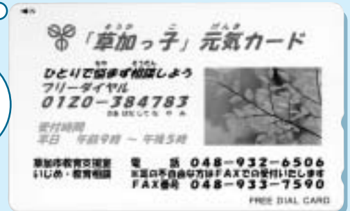
(公衆電話にカードを入れると自動で教育支援室の電話相談窓口につながります)

市立小中学生全員に配布 フリーダイヤル 「草加っ子」元気カード いつでも誰でも安心していじめ根絶のための電話相談ができます。