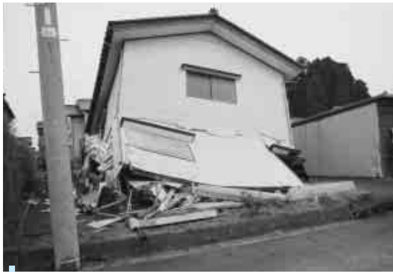
新潟県中越沖地震で被災し1階部分が押し潰され倒壊した家屋

兵庫県南部地震では、6400人以上が犠牲となり、約21万棟の家屋が全半壊しました。亡くなった人