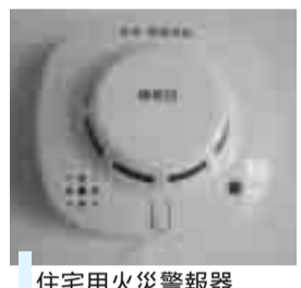
住宅用火災警報器

から15歳以上50歳以下に設置。エアコン等の吹き出し口から1.5m以上離す。種類: 煙式感知器(防炎取扱店・家電取扱店・ホームセンター等で購入可) 消防本部予防課 ☎922・2111 対象: 戸建住宅・併用住宅(店舗部分は除く)・共同住宅等(共用部分は除く) 設置場所: 寝室・階段(2階以上に寝室がある場合) 天井か壁に設置。天井に設置: 壁・梁から60cm以上離す。壁に設置: 天井