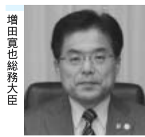
増田寛也総務大臣