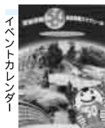
イベントカレンダー

市内在住・在学・在勤者対象。1人何点でも応募できます。 採用者は7月上旬に開催予定の同日開催まつり記念シンポジウムで表彰、記念品が贈呈されます。 6月6日(金)までにはがきに住所・氏名(ふりがな)・年齢・連絡先・勤務先または学校名(学年)・名称(簡単な説明)を明記し、〒340 8550 同日開催まつり運営委員会事務局(みんなであちづくり課内)へ。ファクス・Eメールでも可。☎922・0796 〒922-3406 Omachi dukur@city.soka.saitama.jp 草加市制50周年記念事業スケジュール(イベントカレンダー)ができました