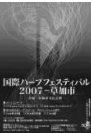
昨年の最優秀賞作品

「国際ハーブフェスティバル」は、毎年11月に草加で開催されるハーブの祭典。国内外の一流ハービストの演奏はもとより、アジア唯一のハーブコンクールのほか、駅や学校でもコンサートが楽しめます。 同フェスティバルを彩るポスターデザインを募集します。 応募条件 未発表の自作 諸権利は全て主催者に帰属 ポスター以外の印刷物にも利用(作者も明記) 出品に係る諸経費は応募者負担 作品の返却不可 1人何点でも応募可 賞金 最優秀賞(1点) 5万円、優秀賞(1点) 3万円、佳作(2点) 1万円 7月10日(木)までに草加市文化会館まで配布する応募用紙に記入のうえ、作品に出品票を添付し、〒340 0013 松江1-5(財)草加市文化協会へ。なお、応募用紙・出品票は文化会館ホームページ(http://soka-bunka.jp)からダウンロードできます。 ☎931・9325