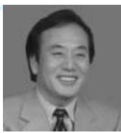
上田清司埼玉県知事

記念館 出席予定者 増田寛也総務大臣、上田清司埼玉県知事、雨宮昭一獨協大学地域総合研究所所長、木下博信草加市長 6月6日(金)までに住所、参加者名、連絡先を総合政策課へ。フアクス・Eメールでも可。 総合政策課 ☎922・0749 ☎924・8672 sogoseisaku@city.soka.saitama.jp