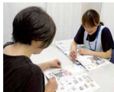
特定保健指導を受けた人の声 (令和4年、同事業参加者データ)