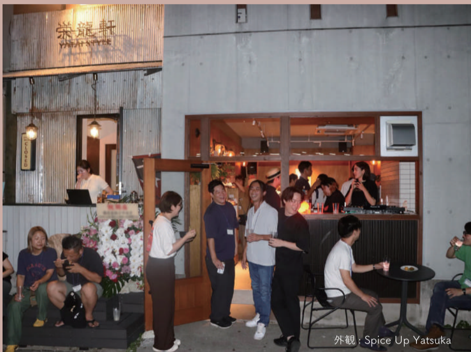
外観: Spice Up Yatsuka

「Spice Up Yatsuka」は、「Spice up!」をテーマに、日常にスパイスを加えるような、刺激的でワクワクする体験を提供することをコンセプトとする複合施設です。喫茶と酒場、担々麺スタンド、プライベートサウナなどが併設された施設では、食や学習、コミュニティなどを通じて、日常を今よりも面白く、ホットにする要素が盛りだくさんです! 「Spice Up Yatsuka」を拠点に、今後も谷塚エリア全体を「Spice up!」させるような、様々なプロジェクトが仕掛けられる予定です!