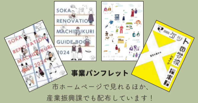
市ホームページで見れるほか、産業振興課でも配布しています！

日光街道第2の宿場町として繁栄してきた草加市では、そうかりノベーションまちづくりを8年間実施してきたことにより、市民等の主導で、まちに魅力的なコンテンツが次々と誕生してきました。 こうして誕生したコンテンツを通じて、人と人がつながることで、まちへの愛着と共感の輪が広がり、顔の見える経済循環が草加のまちで体現されつつあります。