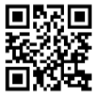
支援はこちらから！

あなたの支援でまちの未来が変わる！ 地域をつなぎ、笑顔あふれるマーケットを創る挑戦を応援してください！