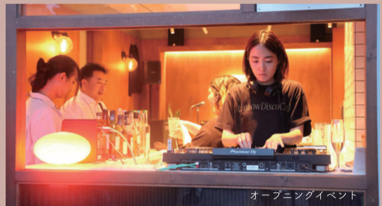
オープニングイベント

「Spice Up Yatsuka」は、「Spice up!」をテーマに、日常にスパイスを加えるような、刺激的でワクワクする体験を提供することをコンセプトとする複合施設です。喫茶と酒場、担々麺スタンド、プライベートサウナなどが併設された施設では、食や学習、コミュニティなどを通じて、日常を今よりも面白く、ホットにする要素が盛りだくさんです! 「Spice Up Yatsuka」を拠点に、今後も谷塚エリア全体を「Spice up!」させるような、様々なプロジェクトが仕掛けられる予定です!