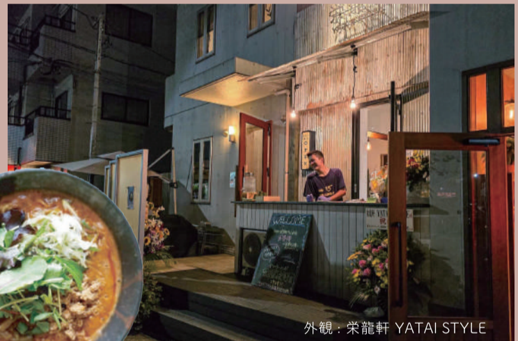
外観: 栄龍軒 YATAI STYLE

昼は喫茶、夜は酒場の日替わりキッチン。 店内には、作家やアーティストによる物販コーナーも!