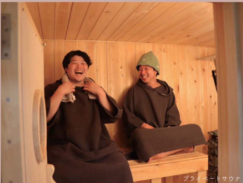
プライベートサウナ

70年以上継承される「丸長」ルーツの「醤油らーめん」や栄龍軒オリジナル「担々麺(赤・白・黒)」が屋台スタイルで谷塚に!!