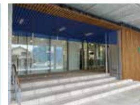
設置場所はコチラ