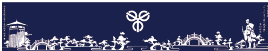
▲草加の名所を描いたのれんです

内 注染の歴史・作業工程等の紹介、本染め作品等の展示、本染めゆかた・手ぬぐい等の販売