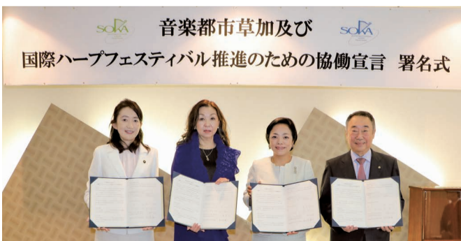
音楽都市草加及び 国際ハープフェスティバル推進のための協働宣言 署名式