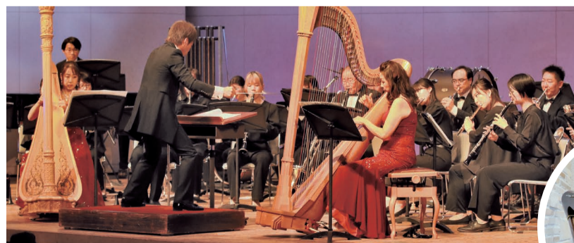
休憩時間のタッチザハープも大人気▼

11/18日と19日に、草加市文化会館でメインコンサートが開催されました。今年は同フェスティバルが35回目、市が音楽都市宣言をしてから30周年という節目の年。市と草加市文化協会、日本ハープ協会、上野学園大学の4者でこれからも共に音楽都市草加でハープを推進していくと明記した宣言書に署名し、協働宣言を行いました。