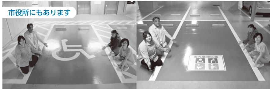
▲市役所の駐車スペースは、(株)アークスの協力で就労訓練生実習生の皆さんに塗装していただきました。