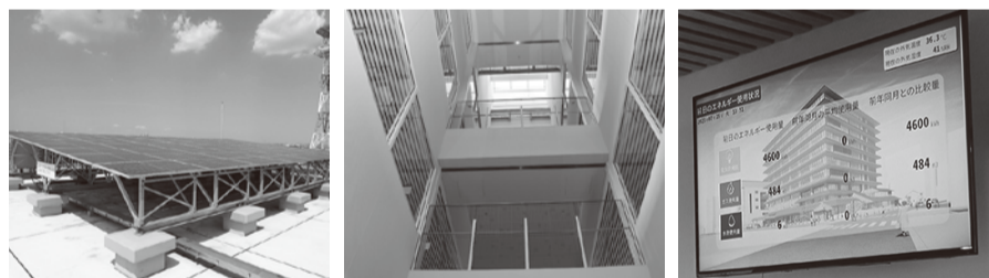
屋上太陽光パネル