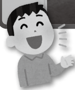
しゃべれる傍聴席