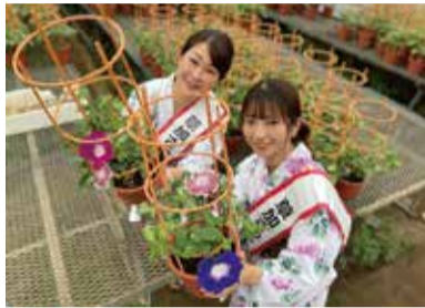
※写真は第16代さわやかさん