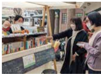
▲草加駅前で開催したマーケットの様子