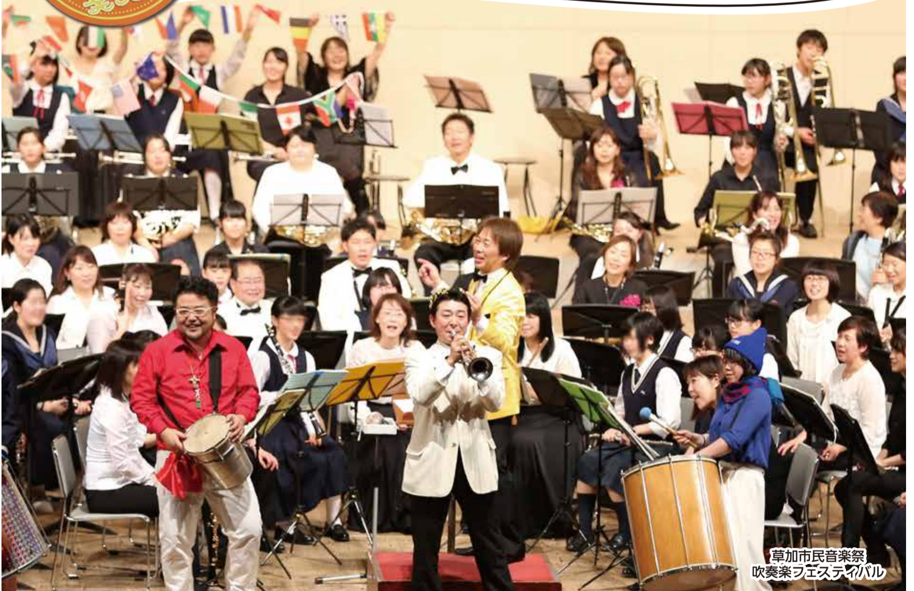
草加市民音楽祭 吹奏楽フェスティバル