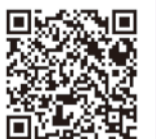
音楽都市宣言 HPはこちら