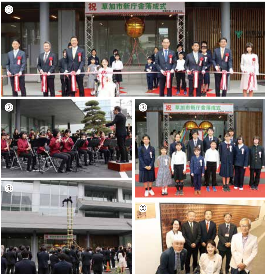
①テープカット・くす玉開披②草加中吹奏楽部の演奏③式典に参加した草加の未来を支える学生代表の皆さん④草加篤職組合のはしご演舞⑤メモリアルプレート引渡式典

5月8日から供用開始となる市役所新庁舎で、落成式とメモリアルプレート引渡式典が行われました。22日に開催された落成式では、草加中吹奏楽部の演奏や来賓によるテープカット、草加篤職組合による演舞などのセレモニーが行われました。24日に開催されたメモリアルプレート引渡式典では、企画・製作に携わった草加市役所本庁舎メモリアルプレート事業実行委員会から本市へ同プレートが引き渡されました。