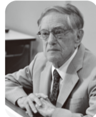
ドナルド・キーン氏

6/18④「ドナルド・キーンとの思い出」・25④「日本文学を世界に広めたドナルド・キーンが遺したものの」。各14時～16時。全2回。会場は草加市文化会館。ドナルド・キーン氏ご子息のキーン誠己氏と生前交流のあったゲストの対談型講演会。定員40人。参加費4000円。④5/13④9時～電話で草加市文化協会へ。☎931-9326④936-4690