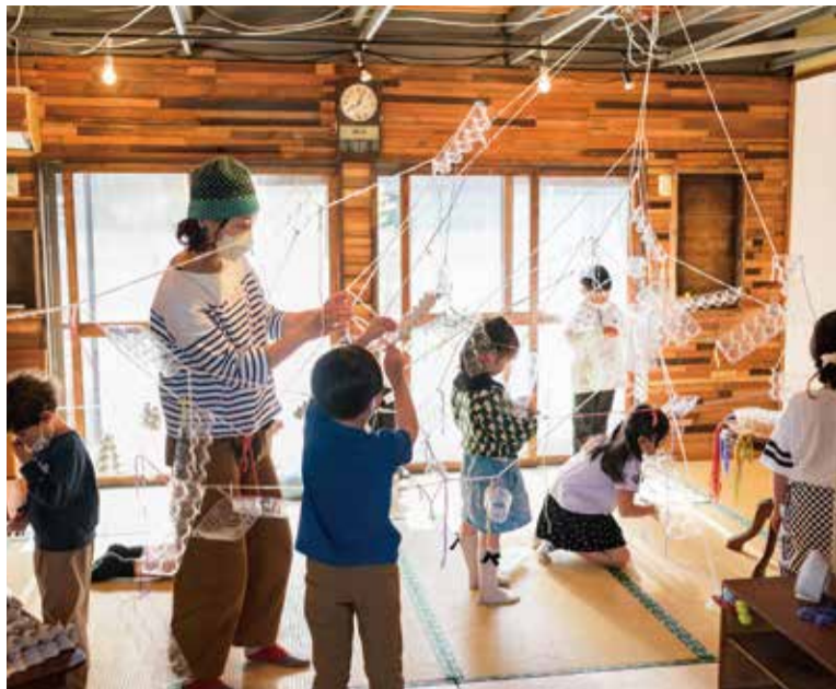
子ども向けワークショップ