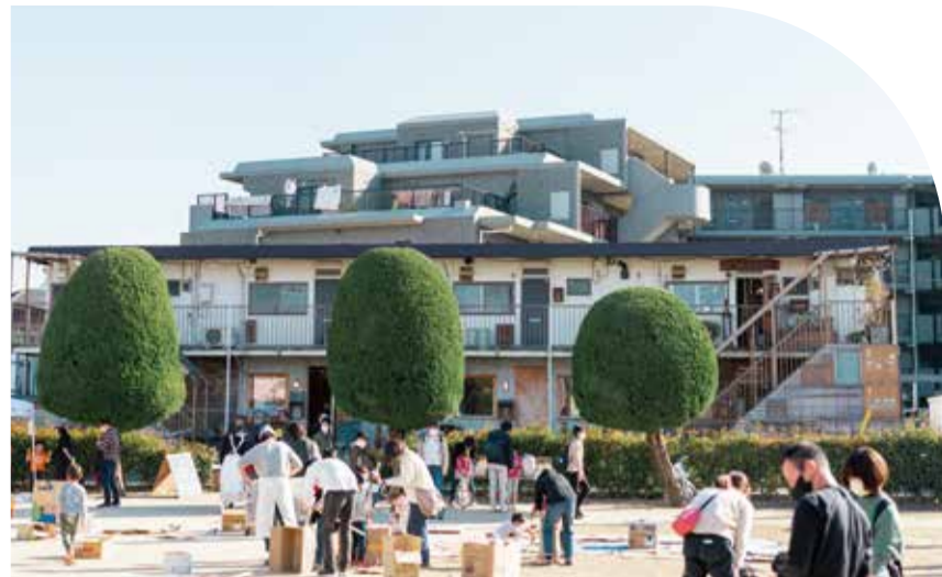
隣接する八幡西公園のシンボルツリー