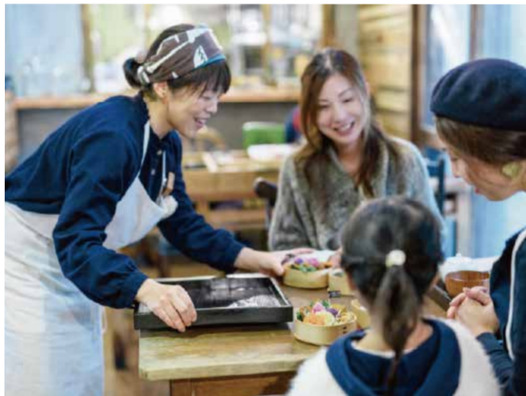
ランチのシェフは日替わり