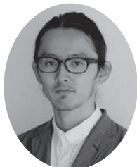
藤村龍至氏 建築家/ 東京藝術大学 准教授