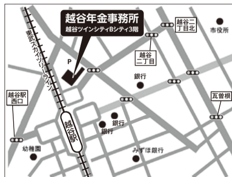
越谷市弥生町16-1越谷ツインシティBシティ3階

「国民年金の納付書を郵送してほしい」「私の年金額はいくら？」 「納め忘れていた保険料はあるかしら？」などの問い合わせや、年金に関する書類の再発行