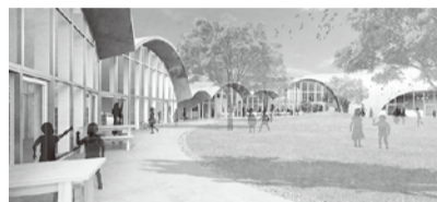
松原児童青少年交流センター完成イメージ図

令和4年10月に使用開始するため松原児童青少年交流センターの建設工事を実施します。