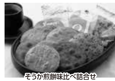
そうか煎餅味比べ詰合せ