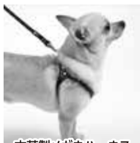
革製メガネハーネス