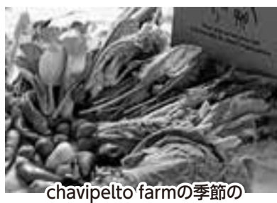
chavipelto farmの季節の オーガニック農産物(有機認証農産物)