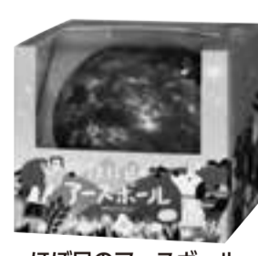
ほぼ日のアースボール