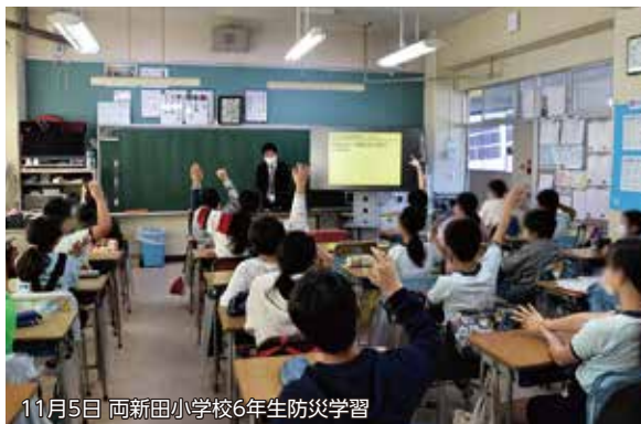
11月5日 両新田小学校6年生防災学習

小学6年生と中学2年生は、授業の中で、今の自分たちにできること、大人になった時に地域の一員としてできることについて学んでいます。