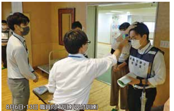
8月6日・13日 職員向け訓練(受付訓練)

災害対策本部への情報伝達訓練や避難所の開設訓練など、大規模災害の発生を想定した研修を定期的に行っています。