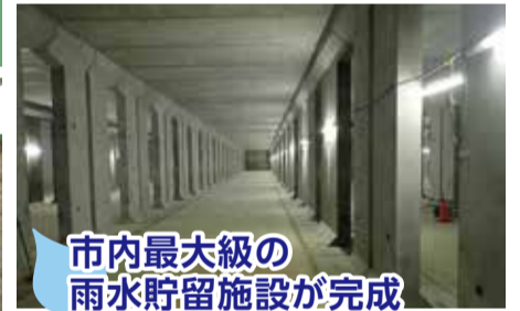
市内最大級の 雨水貯留施設が完成

松原四丁目の「(仮称)松原テニスコート」予定地の下に設置。この施設は、大雨の際、約1万500㎡(25mプール約22杯分)の雨水を一時的に貯め、河川の水位が低下した後にゆっくりと河川へ排水します。