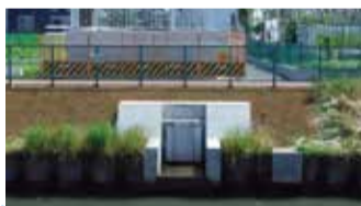
新里グラウンド南側の河川にポンプを新設

市内には地図上の施設のほかに小規模な排水施設がたくさんあり、新たに毛長川へ排水するためのポンプを新里防災広場(新里グラウンド)南側に設置しました。