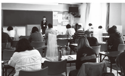
▲過去の就職セミナーの様子