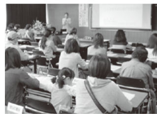
開催日時等は9月頃です。詳細は今後、広報やHP等で公開します。

お子さんの成長時期に合わせて三つのテーマで講演会を開催します。各回、テーマに合わせて著名な講師をお迎えし、子どもとの関わり方や生活習慣等について講演を行います。昨年、ご好評いただいた動画配信での開催を予定しています。参加は無料です。