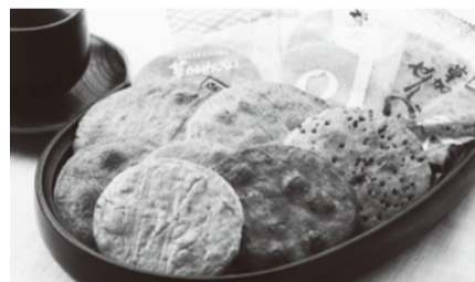
▲草加煎餅味比べ詰合せ