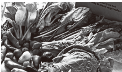
▲季節のオーガニック農産物 (有機認証農産物)