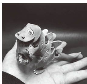
▲そうかいじゅう (おうちでつくろうキット)

■3月の放射線量等 ○大気中放射線量(単位：マイクロシーベルト/時) 最大値0.08/最小値0.08 (市役所前)