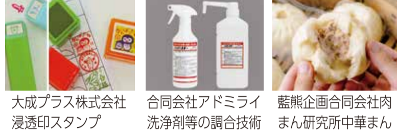
大成プラス株式会社 浸透印スタンプ 合同会社アドミライ 洗浄剤等の調合技術 藍熊企画合同会社 肉まん研究所中華まん