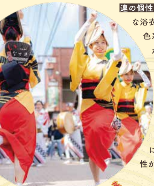
一番通り春まつりでの一幕

連の個性や世界観を象徴する衣装。伝統的な浴衣や編み笠を基調としながらも、色彩や柄、小物使いなどに工夫が凝らされており、演舞に華やかさを添えています。浴衣や手ぬぐいには、 草加の伝統技術や地場産業が使われている こともあるのだそう。衣装の細かな違いに注目すると、各連が大切にしている雰囲気や表現の方向性がより鮮明に伝わってきます。