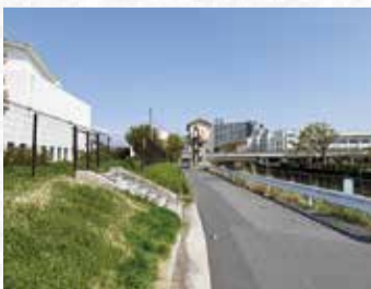
辰井川排水機場南側

協議を行ってきた。現在、具体的な設置位置などについて、協議を行っているところだが、当該道路付近には電柱がないことから、電源の確保が課題である。