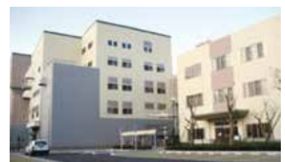
草加市リサイクルセンター

答 粗大ごみ処理コンベヤーラインにサーモグラフィカメラ1台、散水栓5台を、不燃ごみ処理コンベヤーラインにサーモグラフィカメラ1台を設置する予定。