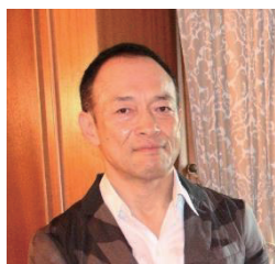
長谷川 権 Hasegawa Kai

俳人。朝日俳壇選者、ネット歳 時記「きごさい」代表、俳句結 社「古志」前主宰、「蛇笏賞」（角 川文化振興財団）選考委員。サ ントリー学芸賞、読売文学賞受 賞。