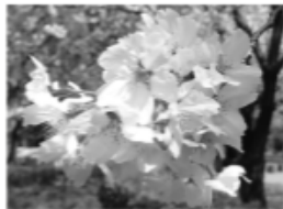
▲サクラ （ソメイヨシノ）