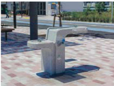
バリアフリー水飲み