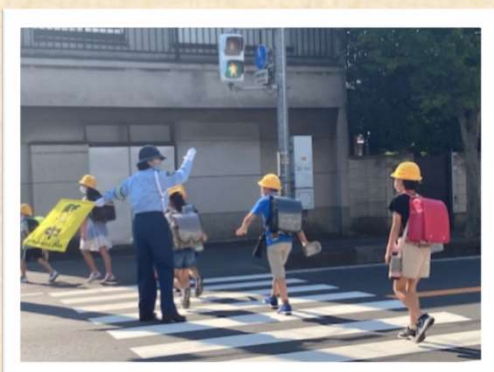
登校時の交通安全指導