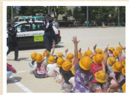
小学校での交通安全教室