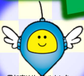
草加市リサイクルセンター マスコットキャラクター クルリ