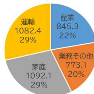
2020年度 部門別エネルギー起源CO 2 排出量と割合