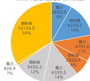
2020年度 部門別電力・燃料等需要