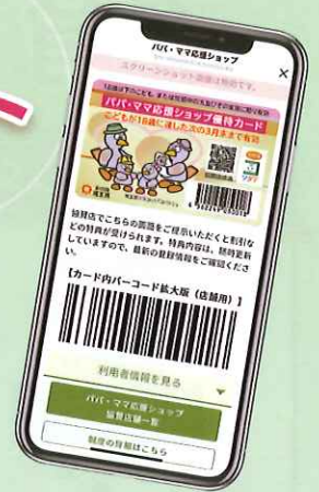
優待カード提示画面 (※画面イメージ)