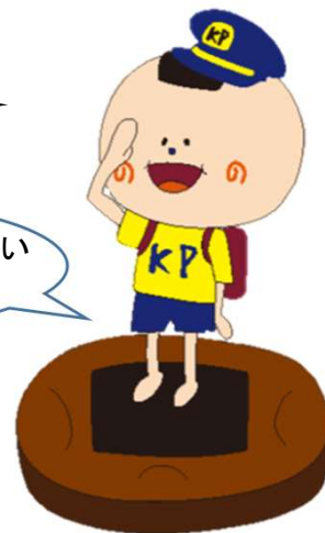
草加市特殊詐欺防止啓発キャラクター のり夫君