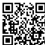
詐欺・交通事故防止動画