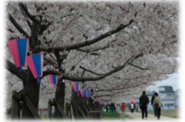
距離：約3km 所要時間：約35分

桜並木1.6kmを含む綾瀬川沿いを歩くコースです。周辺には鳥居にワラで作られた蛇がかけられている旭神社（氷川神社）もあります。