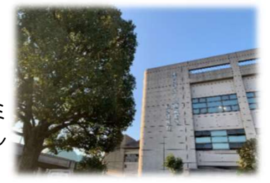
距離：約2km 所要時間：約25分

記念体育館通りを歩くコースです。周辺には公園や、クールオアシスそうか(瀬崎コミセン)があるため、休憩しながらゆったりウォーキングを楽しめます。