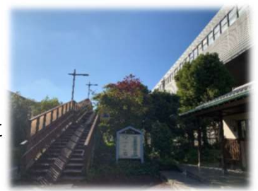
距離：約4.9km 所要時間：約1時間

草加市を横断する、東京外環自動車道沿いを歩くコースです。旭町・新善町・原町を通るルートで、約4.9kmとしっかりウォーキングを楽しみたい方におすすめのコースです。