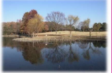
距離：約1.5km 所要時間：約20分

約12,000㎡と市内で最も大きく、ひょうたんの形をした修景池など、公園内の豊かな自然を楽しみながら歩ける周回コースです。秋には紅葉を楽しむことができます。