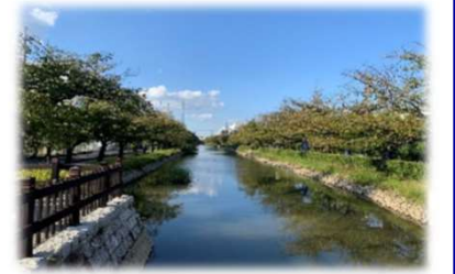
距離：約2.6km 所要時間：約30分

春には満開の桜の下でウォーキングを楽しむことができます。4月には「さくらまつり」も開催され、多くの人でにぎわいます。