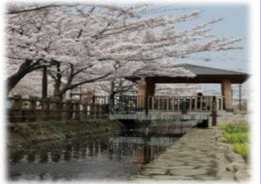
距離：約5km 所要時間：約1時間

谷古田用水沿いには、地元の方々によって植えられた桜が楽しめます。親水公園もありますので、休憩もできて自然を楽しむことができます。