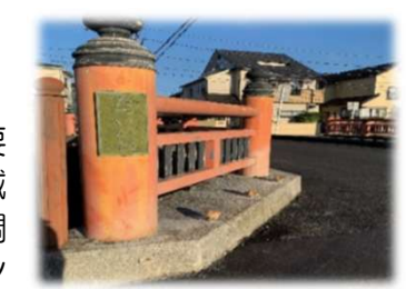
距離：約2.5km 所要時間：約30分

辰井川にかかる橋には、「ながめる」「ふれあう」「ほこる」という要素も取り入れられ、地域の歴史や周辺の自然と調和する個性的なデザインが楽しめます。