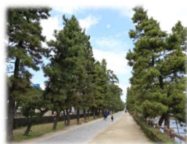
距離：約1.6km 所要時間：約20分

旧日光街道綾瀬川沿いの松並木は草加の代表的景観で「日本の道百選」「利根川百景」にも選ばれています。