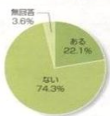
☆喫煙経験 (中学3年男子)