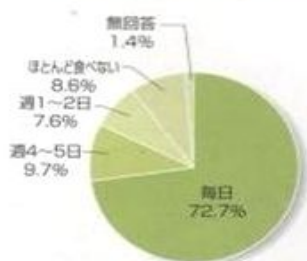
☆朝食の摂取頻度 (中学3年)