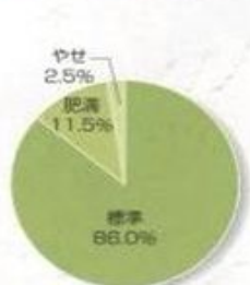
☆肥満度 (小学生男子)