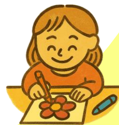
塗り絵付き 応援メッセージ

ミニボウリングゲーム体験・各種健康チェック・選手へ塗り絵付き 応援メッセージを2つ以上体験してボウリング 1ゲーム無料券 をもらおう!!