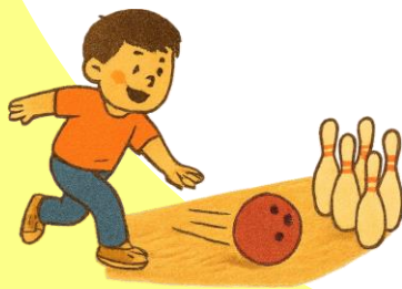
ミニボウリングゲーム体験