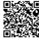
草加市ホームページ