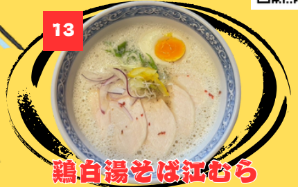
13 鶏白湯そば江むら

鶏の旨味が凝縮された奥深さとクリーミーなコクのあるスープが、モチモチの中太麺と相性抜群！店内はオシャレかつ落ち着いた雰囲気でお客さまも多いです。