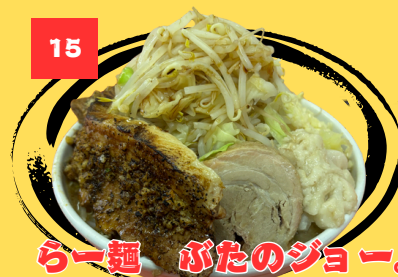
15 らーめん ぶたのジョー。

幅広い年齢層に二郎系ラーメンを食べてほしいという店主の気持ちから、親しみやすい二郎系ラーメン。オススメのトッピングは豚テキサスステーキで食べごたえ抜群！