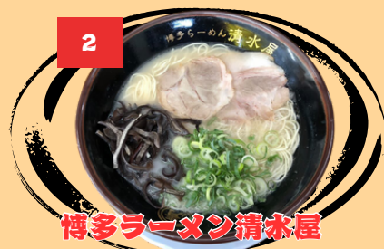
博多ラーメン清水屋

市内には数少ないとんこつラーメンの専門店。極細麺はスープによく絡み、たっぷりの木耳とネギが程よいアクセントを生む極上の逸品！夜遅くまで営業しているため、締めとしても最適です。