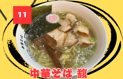
11 中華そば 龍

一番人気の中華そばは、塩味がきいた黄金色の透き通ったスープであっさりとしているが、奥深く最後まで飲み干したくなります。麺はほどよくコシがあり、喉越しもよく、スープとの一体感があります。ランチタイムの麺大盛りや肉飯などのサービスも嬉しいポイントです！