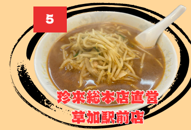
珍来総本店直営 草加駅前店

定番のしょうゆ味をはじめ、ミソ味、塩味のらーめんも種類が豊富で、麺の硬さやトッピングなど自由にアレンジできます。ミソラーメンには珍来が共同開発したらーめん用の天然醸造ミソが使用されており大人気です。