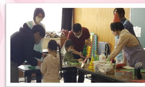
「パパと楽しむクリスマス工作」 11/27(日)実施