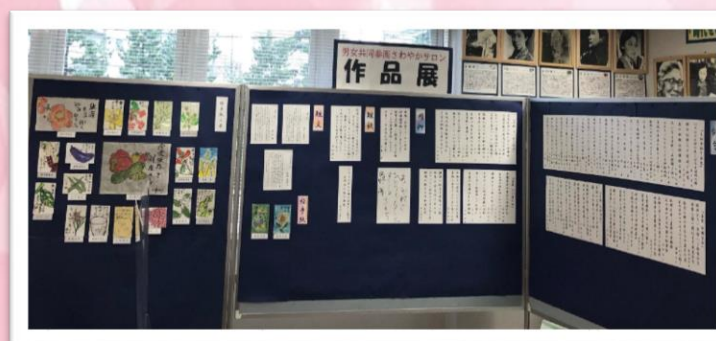
作品展「育む」 7/29(金)～8/31(水)展示