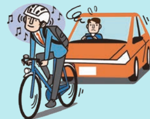
イヤホン等使用運転