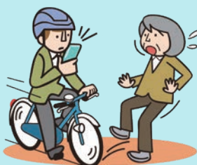
スマホ等使用運転