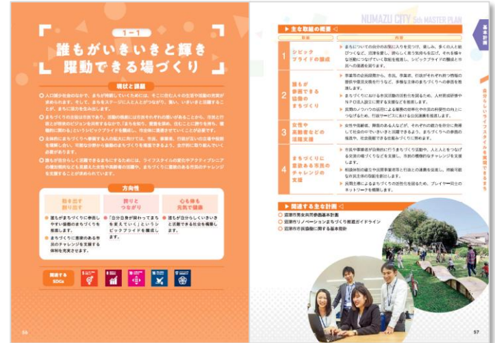
資料：第5次沼津市総合計画