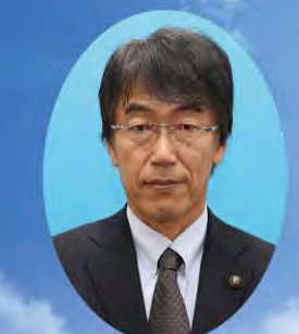
草加市長 浅井 昌志

草加市は埼玉県の東南部に位置し、東京都に隣接しています。東京メトロ（地下鉄）日比谷線や半蔵門線との直通運転を行う東武スカイツリーラインが市の南北を縦断する交通アクセスに非常に恵まれた都市です。昭和33年（1958年）11月1日に人口3万4878人で市制施行後（県下21番目）、高度経済成長とともに急激な都市化が進行し、昭和43年（1968年）には人口が10万人を突破、現在では24万人を超えています。 江戸時代に日光街道の宿場町として栄え、俳聖・松尾芭蕉の『おくのほそ道』にも「その日やうやう早加といふ處にたどり着きにけり」と記されています。また、江戸時代から受け継がれる「草加せんべい」は、市を代表する名物であり、全国的に高い知名度を誇ります。市内中央を走る旧日光街道に接する綾瀬川沿いには、「日本の道100選」に選ばれた「草加松原遊歩道」があります。約1.5kmにわたる634本の松並木は市民の憩いの場であり、草加のシンボルとなっています。平成26年（2014年）3月には「おくのほそ道の風景地 草加松原」として、国の名勝に指定されました。 この「タウンガイドマップ草加」は、草加市の公共施設や医療機関などの情報をはじめ、草加の歴史や地場産業など市の魅力や特徴を紹介しています。草加を知り、草加に愛着を持てただければ幸いです。