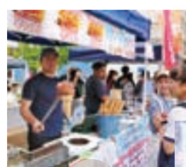
外国の食や言語を楽しんだ国際村一番地

23日に国際交流フェスティバル「国際村一番地」が、30日に草加朝顔市と草加松原夢祭りが開催され、多くの人が、様々な国の食や文化、民芸、朝顔などを楽しみました。